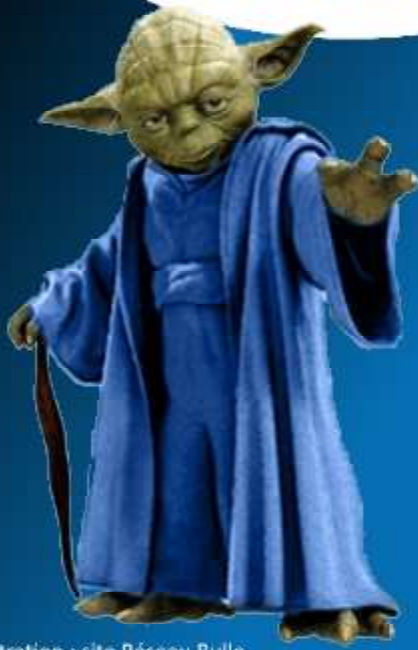
Illustration : site Réseau Bulle